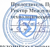
ТАБЛИЦА СООТВЕТСТВИЯ ОБРАЗОВАТЕЛЬНЫХ ПРОГРАММ ПРЕДШЕСТВУЮЩЕГО УРОВНЯ ОБРАЗОВАНИЯ ОБРАЗОВАТЕЛЬНЫМ ПРОГРАММАМ ДОКТОРАНТУРЫ PhD НА 2024-2025 УЧЕБНЫЙ ГОД